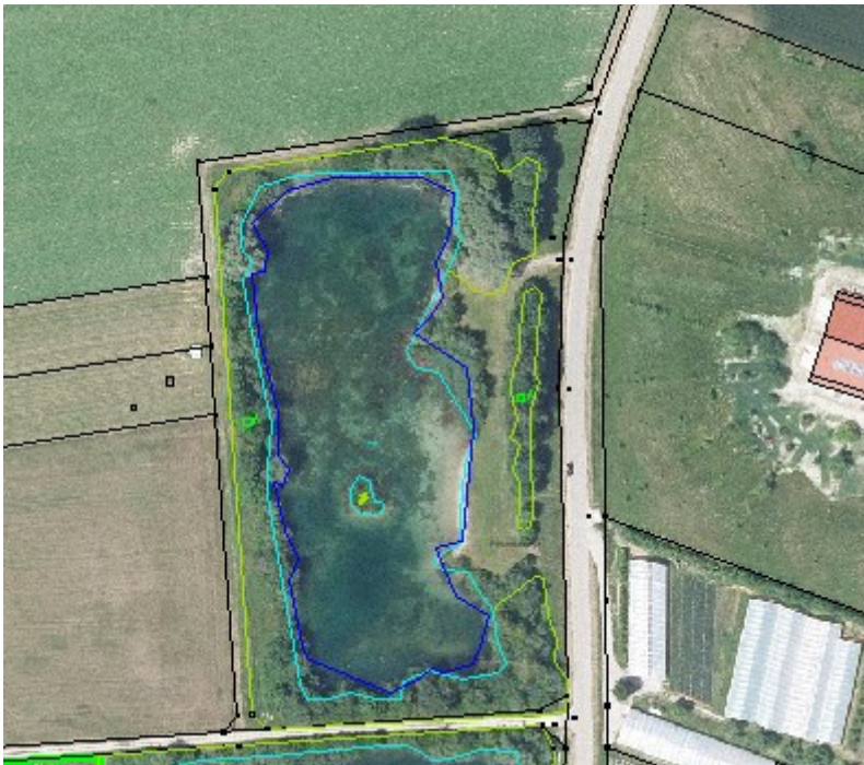
Pachtvertrag über Flst. 764 bis 31.12.2024