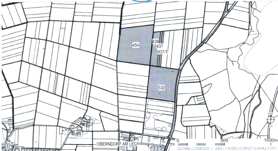
Abbildung 1: Übersichtslageplan, Maßstab 1:10.000, ALKIS, Bayerische Vermessungsverwaltung – www.geodaten.bayern.de